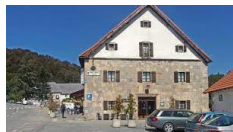
Roncesvalles – Posada de Roncesvalles https://laposada.roncesvalles.es

Una selezione di sistemazioni diverse, che vanno dai tradizionali hotel di paese, pensioni rurali, gli affascinanti e confortevoli hotel rurali, in camere con bagno privato.