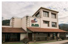
Zubiri – Hosteria de Gautxori https://hostalgautxori.com