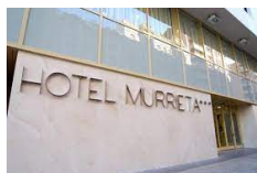
Logroño – Hotel Murrieta https://hotel-murrietalogrono.com