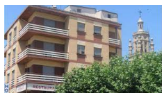
Los Arcos – Hotel Monaco http://www.hotelmonaco.es