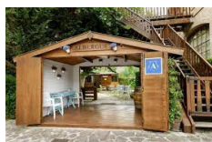
Puente la reina – Hotel Jakue https://www.jakue.com