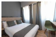
Pamplona – Alda Pamplona Centro https://aldahotels.es/alojamientos/hotel-alda-centro-pamplona