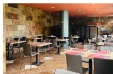
Estella – Hotel Yerri http://www.hotelyerri.es