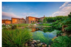
Pazo de Santa Maria - Arzua www.pazosantamaria.com