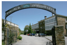
Pousada de Portomarin - Portomarin https://www.pousadadeportomarin.es/