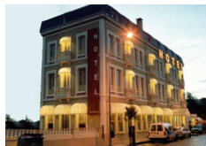
Hotel Restaurante Roma - Sarria https://hotelroma1930.es/

6 pernottamenti in camera doppia in hotels **/***, B&B e agriturismi con prima colazione.