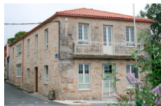
Casa Leopoldo - Palas de Reis https://casaleopoldocaminodesantiago.com/