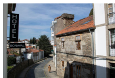
Hotel Ada Bonaval - Santiago de Compostela https://aldahotels.es/alojamientos/hotel-alda-bonaval-santiago/