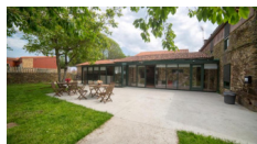
Casa Do Acivro - O Pino https://oacivro.com/?lang=en