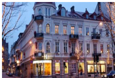
Hotel Linnea, Hoganas http://www.hotell-linnea.se/