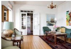
Strand Hotel, Arild http://www.strand-arild.se/