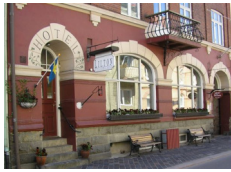
Hotel Lilton, Angelholm http://www.hotel-lilton.se/

Il prezzo include sistemazione in camera doppia / twin condivisa in boutique hotels e b&b, in camera con bagno privato.