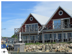
Bryggan Hotell, Hoganas http://www.hoganasbrygga.se/