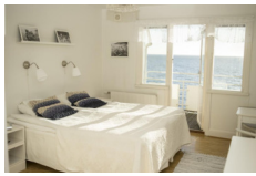
Pensionat Strandgarden, Molle https://pensionat-strandgarden-molle.hotelmix.it/