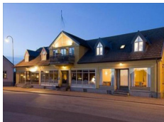
Hotell Köpmansgården, Hoganas https://www.kopmansgarden.se/