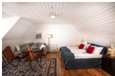
Kullagårdens Wårdshus, Molle https://www.kullagardenswardshus.se/