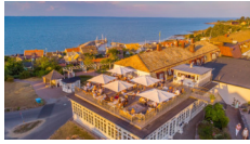
Rusthållaregården, Arild http://www.rusthallargarden.se/