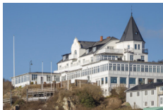
Grand Hotel Olympia, Molle https://www.grandhotelmolle.se/