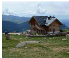
Rifugio Resciesa - Ortisei https://www.rifugioresciesa.com/it/