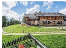
Rifugio Kreuzwieser Alm - Lusen https://www.kreuzwiesenalm.com/it/