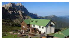
Rifugio Genova - Funes http://www.schlueterhuetten.com