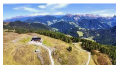
Rifugio Monte Muro - San Martino in Badia https://www.maurerberg.com/