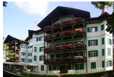
Residence Gasser - Bressanone https://www.gruenerbaum.it

In questo viaggio non è previsto il trasporto bagaglio .