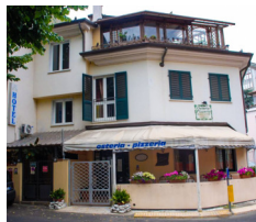
Hotel Annunziata - Massa www.hotelannunziata.com